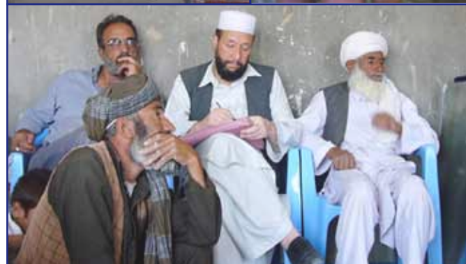
Eindrücke aus Herat - früher die „Perle von Persiens Osten“ genannt