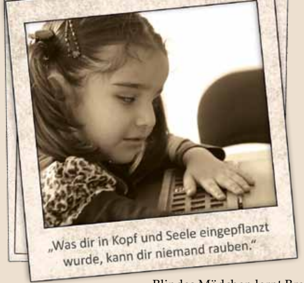
Blindes Mädchen lernt Braille - die Blindenschrift

Ich kann leider nicht alle unserer ca. 25 Projekte besuchen. Aber was ich gesehen habe, begeistert mich. All diese Projekte helfen Tausenden Afghanen in eine bessere Zukunft. Allerdings kosten sie auch Geld. Ich will Ihnen nicht verschweigen, dass in diesem Bereich derzeit unsere größte Not liegt. Wenn wir z. B. nicht bald Herat unterstützen, müssen die wichtigen Projekte unterbrochen werden. U. a. haben wir dort die modernste Zahnklinik Afghanistans aufgebaut, Zahnärzte werden ausgebildet. Der normale Unterhalt kostet