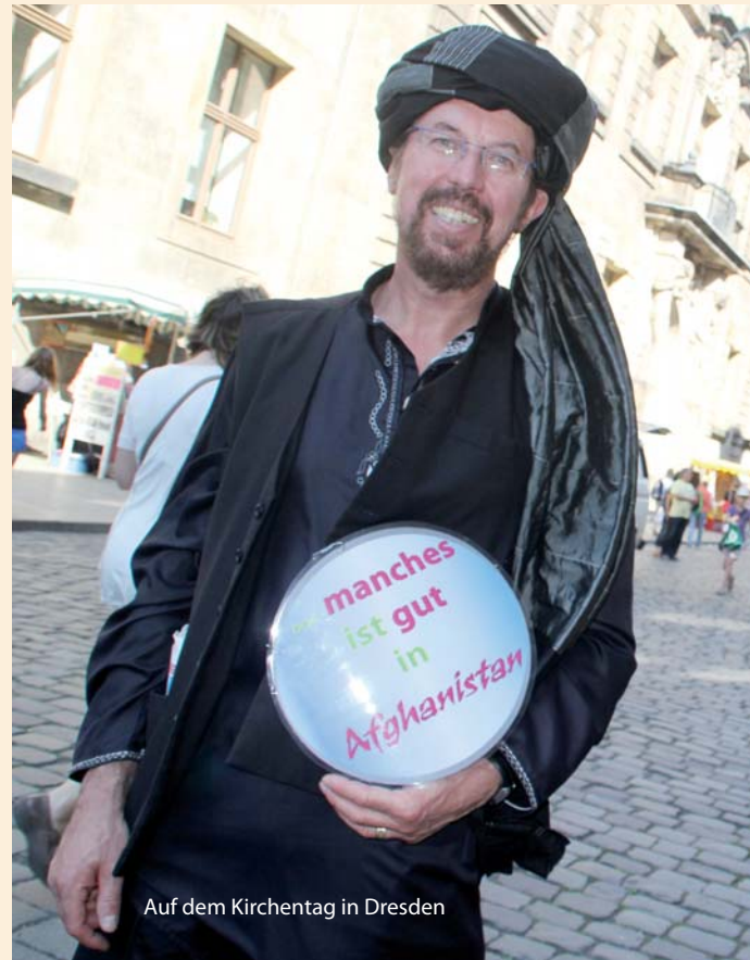
Auf dem Kirchentag in Dresden