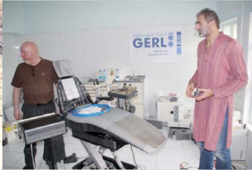
Bienen in Paghman. Der 5. Behandlungsstuhl wird installiert.

In Herat haben vier Freunde aus Deutschland gerade den fünften Behandlungsstuhl installiert. Die Shelter Now Zahnklinik hat inzwischen einen exzellenten Ruf – bis nach Kabul.