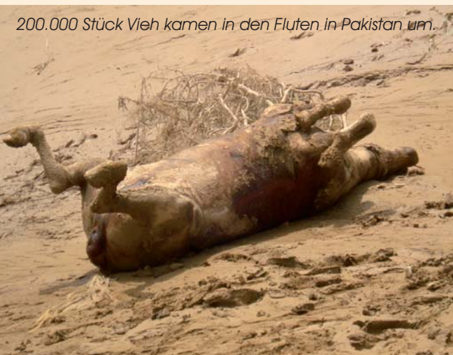
200.000 Stück Vieh kamen in den Fluten in Pakistan um.

Wir schauen uns die neu gebauten Häuser an, noch sind sie zumeist leer und haben keine Fenster und Türen. Die müssen die Dorfbewohner selber beschaffen. Inzwischen wird es sehr heiß, im Sommer gehen die Temperaturen oft über die 50-Grad-Grenze, in Deutschland nicht vorstellbar, zudem ist das Klima feucht: „der Backofen“. Die Familien benötigen zumindest Deckenventilatoren, damit sie die Hitze ertragen können. Kinder werden sonst oft krank, mitunter lebensbedrohlich. Wir versuchen die Finanzen zusammenzubringen um die nötigen Ventilatoren zu beschaffen. Ein Sommer in Pakistan ohne Ventilatoren ist vergleichbar mit einem Winter in Deutschland ohne Heizung.