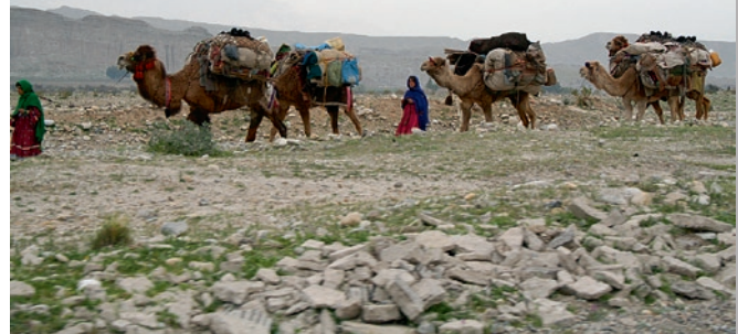
Die Kuchi-Nomaden wandern jetzt wieder in ihre Sommergebiete in den Bergen.

Schlechter sieht es bei den Kuchis aus. Sie haben unter dem langen und harten Winter sehr gelitten. Wir haben 300 Familien mit dem Nötigsten versorgt, trotzdem sind sie sehr verzweifelt. Nur etwa die Hälfte von ihnen hat überhaupt Zelte. Den Winter haben sie in Laghman, östlich von Jalalabad verbracht. Die Männer versuchen dort als Tagelöhner Arbeit zu finden, aber es ist nicht leicht, Kuchis sind nicht beliebt, oft auch gefürchtet. In diesem Jahr werden wir ihnen helfen ihre Schafherden wieder aufzustocken. Darüber werde ich in einem der nächsten Reports berichten.