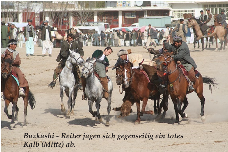
Buzkashi - Reiter jagen sich gegenseitig ein totes Kalb (Mitte) ab.

„Buzkashi“ – dieses Wort allein zaubert ein sehnsüchtiges Lächeln auf die Gesichter vieler Afghanen. Das legendäre afghanische Reiterspiel wird traditionell am „Now Roz“, dem afghanischen Neujahrsfest, so am 23. März, gefeiert. Zufällig besuche ich gerade in dieser Zeit unser Shelter Now Team in Faizabad. Dies ist die Hauptstadt von Badakhshan, der nördlichsten Provinz Afghanistans.