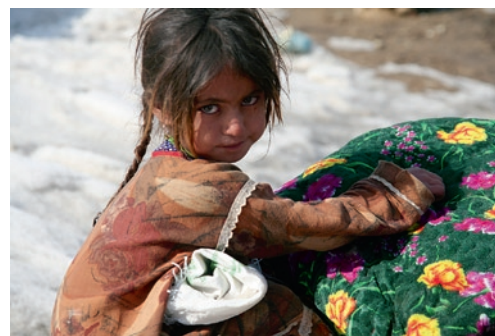
Ein Mädchen in Kabul freut sich über die Wintersachen von Shelter Now. Es musste nun den Winter über nicht mehr frieren und hungern.