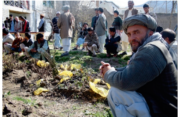
Obstbauern in Nordafghanistan bekommen neue Pflanzen und Instruktionen von Shelter Now.