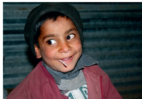
Erdbebengebiet Nordpakistan - ein Grundschüler in einer Behelfsschule. Bald kann er hoffentlich wieder in richtigen Schulräumen lernen.

Unser Spendenkonto: Shelter Now Germany e.V. · Nord/LB Braunschweig Konto-Nr.: 25 230 58 · BLZ 250 500 00 Bitte geben Sie Namen und Adresse bzw. Freundesnummer an! Bei Überweisungen aus dem Ausland: EU: Europakontonummer · SWIFT-BIC NOLADE2H Außerhalb EU: International Bank Account Number IBAN DE65 2505 0000 0002 5230 58