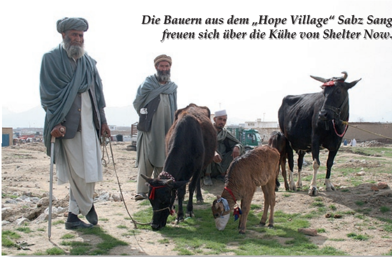
Die Bauern aus dem „Hope Village“ Sabz Sang freuen sich über die Kühe von Shelter Now.

glücklich und dankbar bringen sie ihre Kühe nach Hause. Dort wird nun den ganzen Tag gefeiert. Wir gratulieren ihnen und hoffen, dass unser gemeinsames Projekt Früchte trägt.