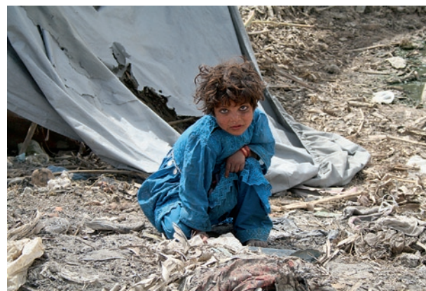
Vielen vor dem Winter heimgekehrten Flüchtlingen konnten wir das Überleben sichern. Sie leben in erbärmlichen Verhältnissen.

P.S.: Besuchen Sie uns im Internet – aktuelle Informationen, interaktive Möglichkeiten: Verschicken Sie eine kostenlose Grußkarte zu Ostern!